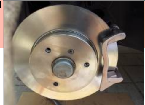
Erneuern der vorderen Bremsanlage