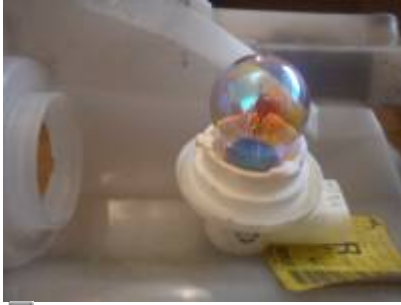
Blinker Birne herausgenommen

Der Einsatz kann nun einfach nach vorne herausgezogen werden.