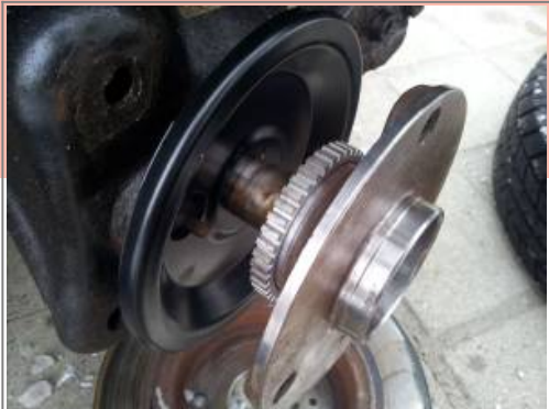
Radlager aufgesteckt, jedoch noch nicht montiert