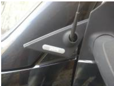
Dreieck über Antenne fädeln

Lässt sich die Antenne nicht mehr abnehmen, was häufig der Fall ist, so kann man das Dreieck auch vorsichtig darüber fädeln. Achtung, auf den Lack aufpassen!